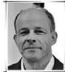
Pr Faouzi BENSEBAA Université de Paris Est - France