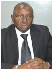
Pr Lamine GUEYE Recteur Université Alioune DIOP Bambey

La Licence en Agrobusiness et en Agro-industrie est créée par l'UADB et Bordeaux Management School (BEM Dakar), avec l'implication de l'Institut Supérieur d'Agriculture et d'Agroalimentaire Rhône-Alpes (ISARA-Lyon), du Centre National de Recherche Agronomique (CNRA) de Bambey et de l'Institut Supérieur de Formation Agricole et Rurale (ISFAR) de l'Université de Thiès. La maquette de cette Licence est totalement conforme aux exigences du système LMD. Son offre de formation est conçue à partir des besoins réels des entreprises agricoles et de l'agroalimentaire.